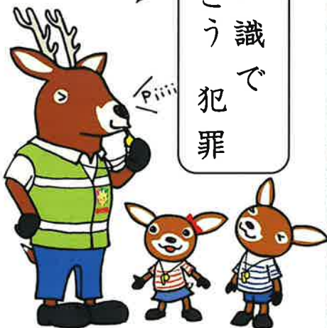
「減らそう犯罪」広島県民総ぐるみ運動 マスコットキャラクター「モシカ」