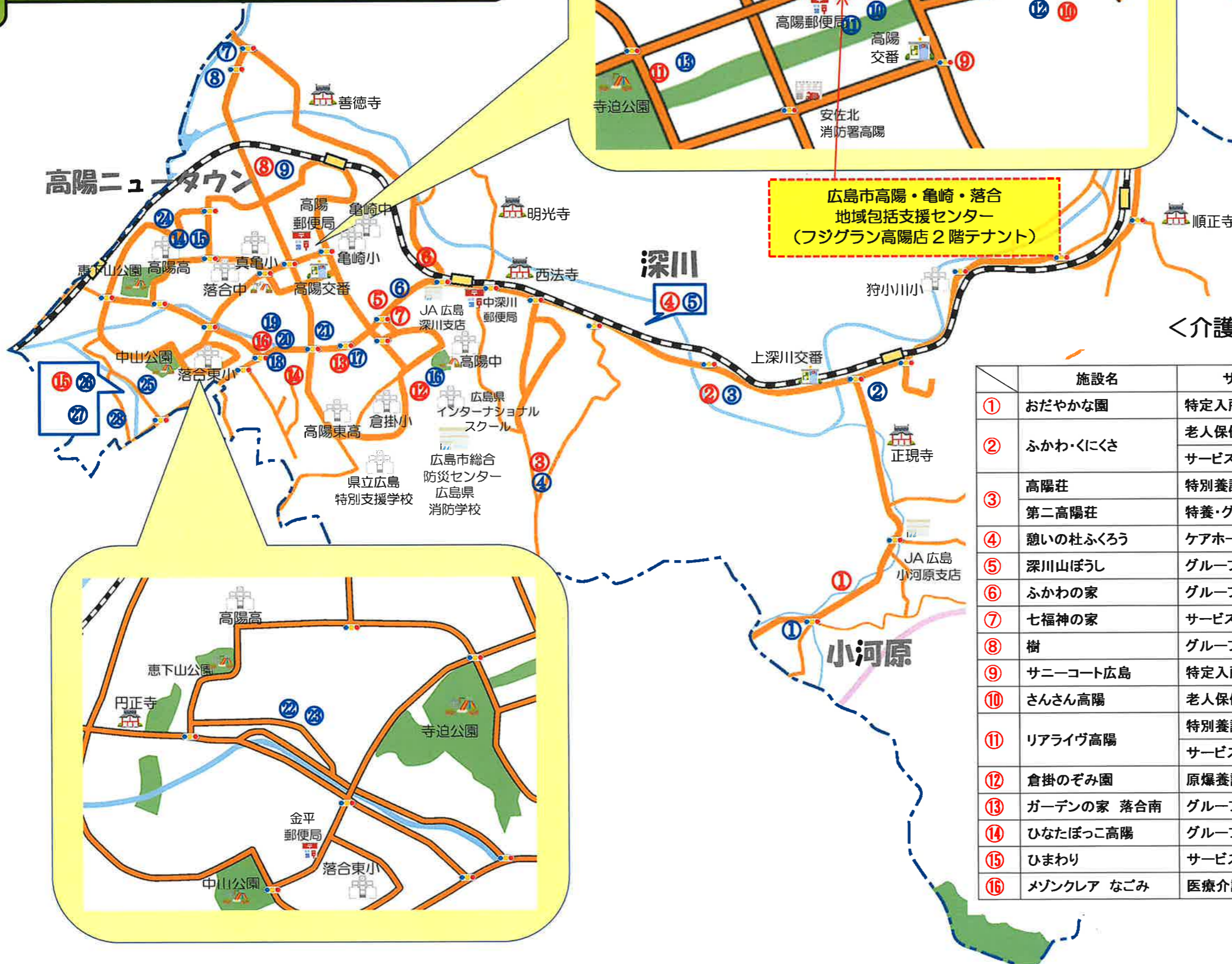
<介護保険等施設一覧>