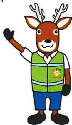
「盗らそう犯罪」広島県民総ぐるみ運動 マスコットキャラクター「モシカ」

〇市区町や総務省等がATMの操作をさせたり、メールで個人情報等を問い合わせたりするのはありません。 〇キャッシュカードや通帳を他人に渡してはいけません。暗証番号も絶対に他人に教えないようにしましょう。