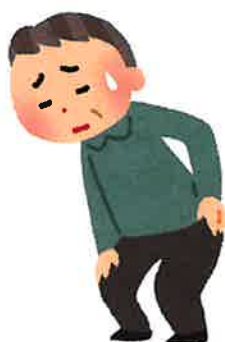
腰や膝などに痛みがでる