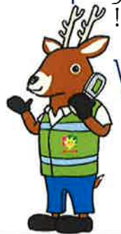
「減らそう犯罪」広島県民総ぐるみ運動 マスコットキャラクター「モシカ」